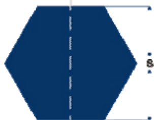
Bară hexagonală trasă (DIN 176)